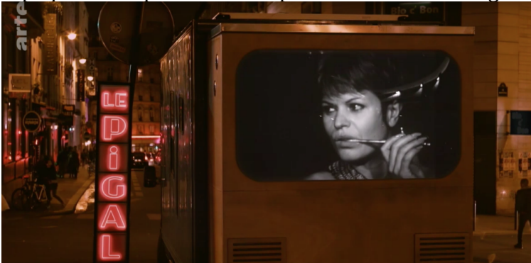
Image extraite du film documentaire «Le Pigalle, une histoire populaire de Paris»

Dans son documentaire «Le Pigalle, une histoire populaire de Paris», David Dufresne revient sur l'époque où ce quartier n'avait pas encore subi le lissage de la boboïsation.