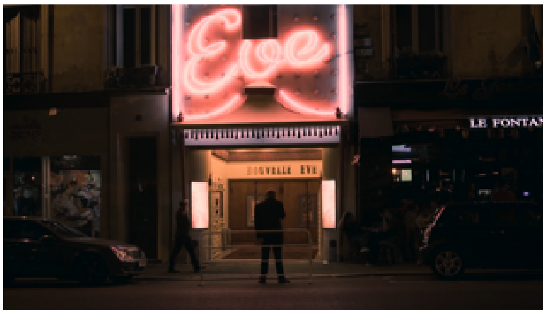
Image extraite du film documentaire «Le Pigalle, une histoire populaire de Paris»

Les rues que connaît David Dufresne sont encore chaotiques comme un centre-ville moyen-oriental, arpentées nuit et jour par les cohortes de travailleurs et travailleuses de l'industrie des plaisirs. Que ce soit le vendeur de crêpes bien grasses, les «chasseurs» qui ramènent des passants dans les bars à strip-tease, le vendeur de journaux, celui qui file des clopes à la sauvette et la prostituée qui racole. Étroitement liée à l'image de Pigalle, la prostitution n'est évidemment pas ce que le coin a de plus glorieux. Un point que le film, qu'on peine à ne pas voir comme l'apologie d'un monde disparu, saisit d'angoisse et de malaise au moment de son traitement.