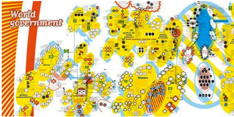
L'une des cartes composant l'atlas pour « une nouvelle citoyenneté émancipatrice » de Bureau d'études à Pau.